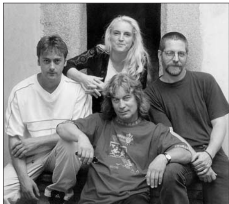
ŽALMAN & spol.