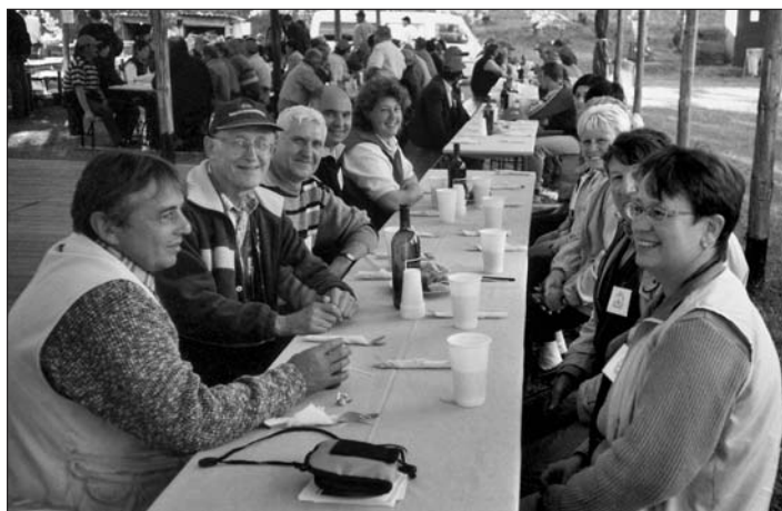
Účastníci setkání obcí Bystré

Úplné znění usnesení zastupitelstva města je k nahlédnutí v kanceláři sekretariátu starostky.