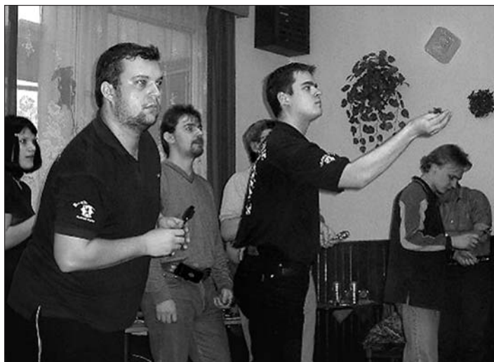
Soustředění při zápase